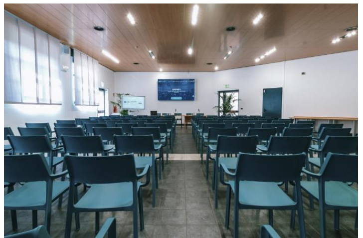
A sinistra il ristorante e a destra la sala riunioni