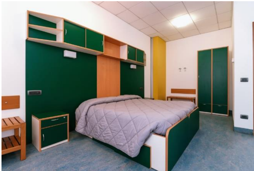
Esempio di camera

Open011 è una struttura ricettiva a pochi minuti dalla stazione di Torino Porta Susa. Open011 è oggi un centro che coniuga ospitalità confortevole a servizi e spazi per incontri, corsi di formazione, eventi.